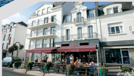
Village du Pouliguen

Port de centre-ville avec accès aux activités nautiques proposées en baie de La Baule (sorties jet ski, location de catas...). Un lieu vivant et animé sur la saison.