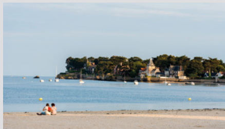
Plage du Pouliguen