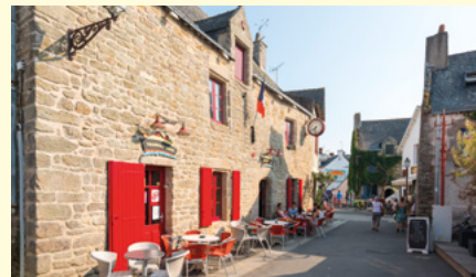
Village de Piriac

Port de caractère facilement accessible et animé sur la saison avec le village et les animations.